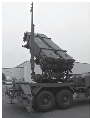
※写真=自民党国防部の提言を踏まえ、防衛省は新たな弾道ミサイル防衛システムの導入に向けた検討を開始している。現行の地上配備PAC-3では、ロフテッド軌道からの高速再突入弾頭に対処することは難しい。相次ぐ北朝鮮の弾道ミサイル発射により、今後弾道ミサイル防衛体制の強化が注目される。